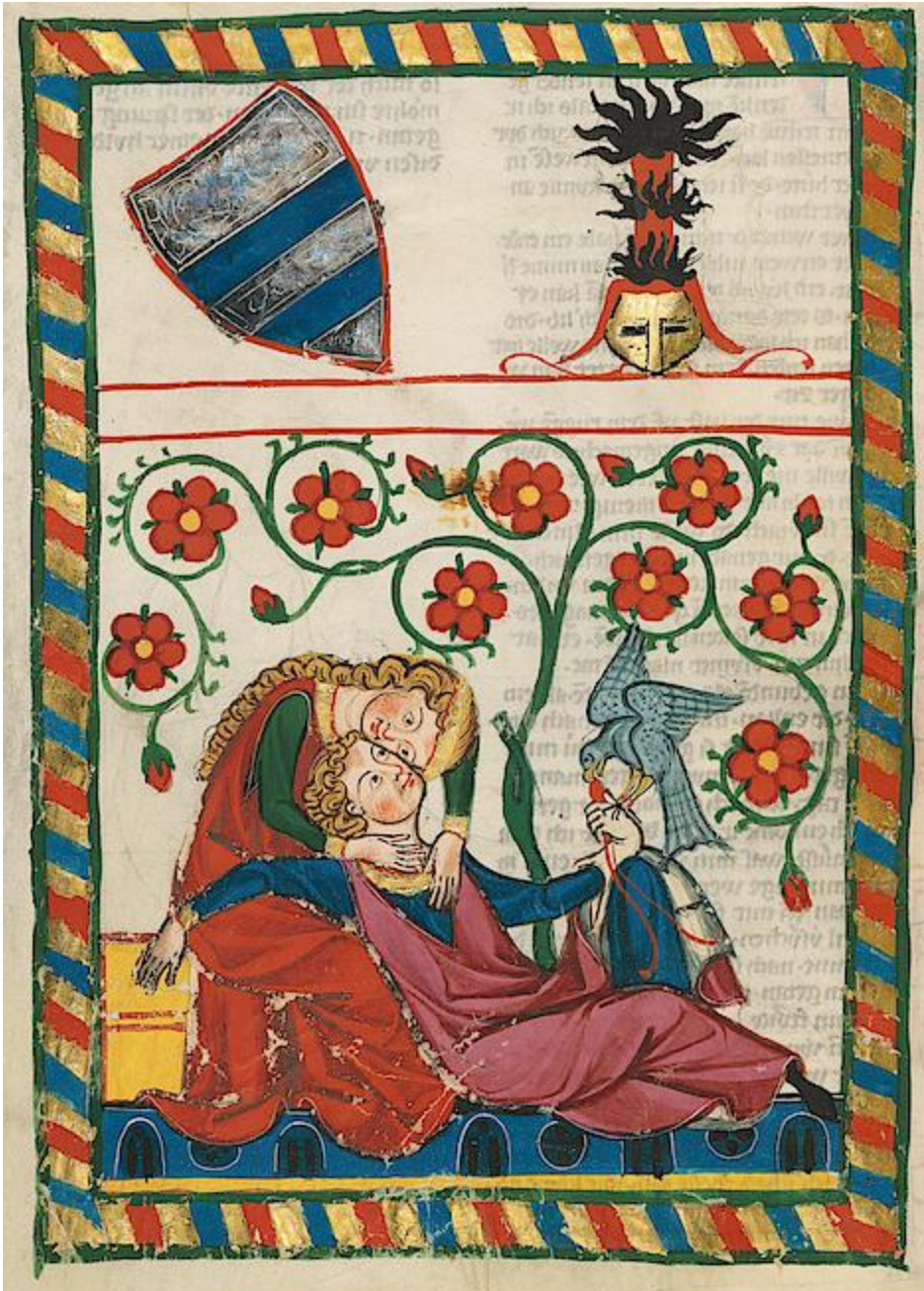
Ein Liebespaar auf S. 249v der Heidelberger Manesse